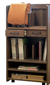
ランドセルラック W60.D35.H110cm