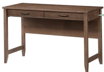
120 デスク W120.D50.H72cm