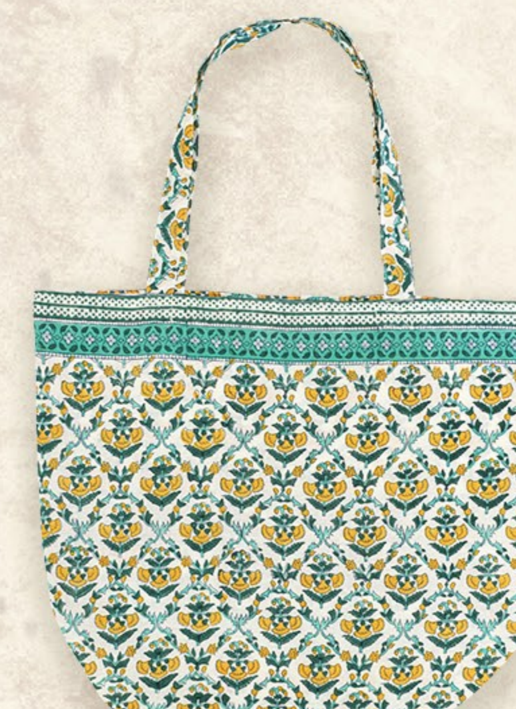
エコポケットダブルバッグ 約32×38cm

可憐なモチーフと可愛い配色が乙女心をくすぐります。 「アマービレ」は「やさしく、愛らしく（演奏する）」という音楽用語 毎日に「愛らしさ」をプラスしてくれます。