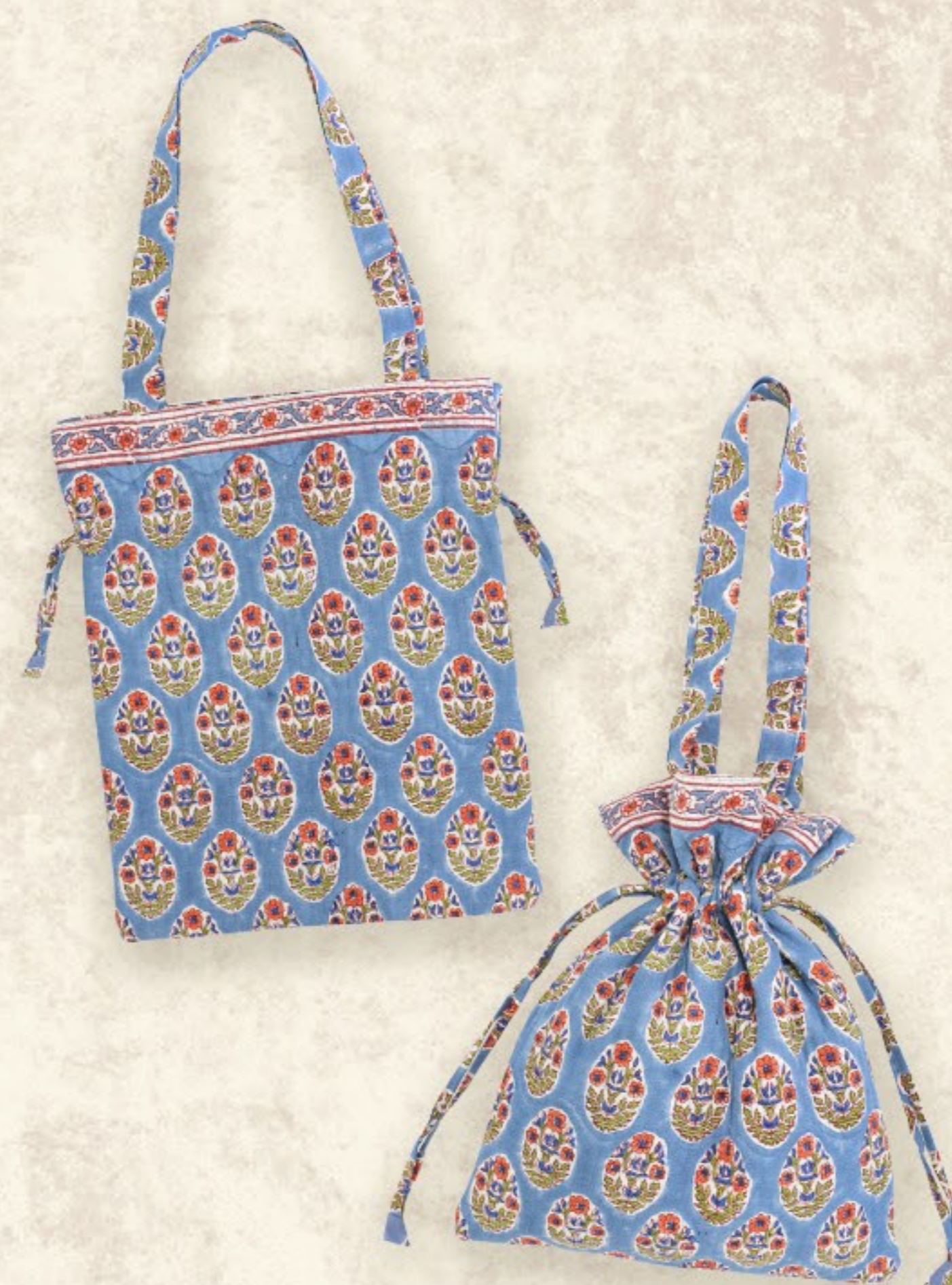
バッグ キルト巾着トート 約31×38cm