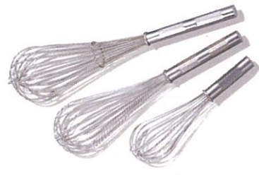
フジボシ耐熱・防水泡立