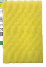
キクロンプロ キズノンスポンジパッド