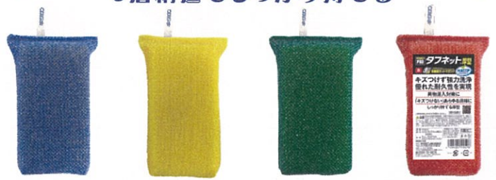
キクロンプロ タフネット厚型

問い合わせ先 株式会社 遠藤孝商店 〒959-1284 新潟県燕市仙木(そまぎ) 2563 TEL.0256-63-5533 FAX.0256-66-0500 E-mail endo-wt@whitethumb.co.jp