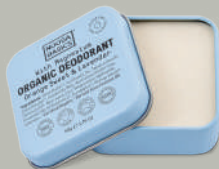
Orange & Lavender オレンジ&ラベンダー