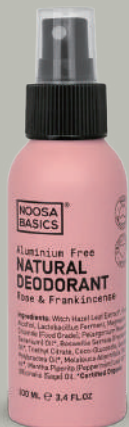
Rose & Frankincense ローズ&フランキンセンス