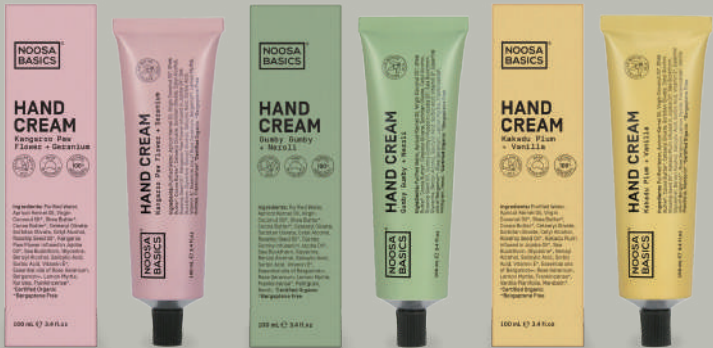
Kangaroo Paw Flower + Geranium カンガルーポーフラワー+ゼラニウム