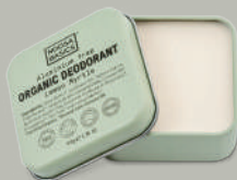
Lemon Myrtle レモンマートル