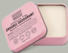
Rose & Frankincense ローズ&フランキンセンス