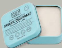
Coconut & Lime ココナッツ&ライム