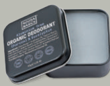
Charcoal & Eucalyptus チャコール&ユーカリプタス

植物由来の保湿成分シアバターやキャンデリラロウ、 皮膚整調成分の天然精油を配合したボディバター。 脇の下や手首などにおいの気になるところに、 練り香水のようにご使用頂けます。 パームオイル・パラベンフリー。